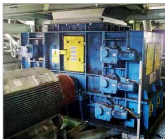
Drtič KDV 1313 drcení uhlí 400t/h