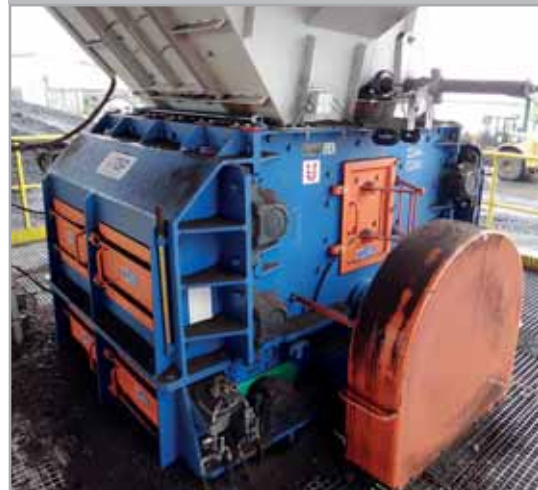
Drtič KDV 1013 drcení uhlí 350t/h