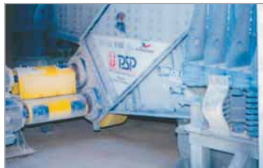
Podavač PVR 1550x6000