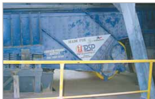
Podavač PVR 1550x6000