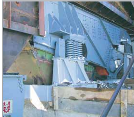
Podavač PVR 1200x6000