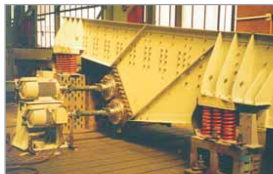
Podavač PVR 1550x6000 na zkušebně ve výrobním závodě.